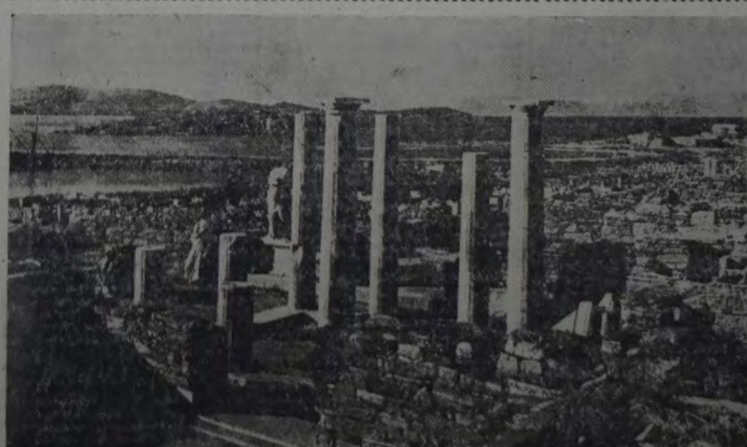
LOS TRABAJOS DE LA ESCUELA FRANCESA DE ATENAS HAN DESCUBIERTO LA CASA DE CLEOPATRA Y DIOSCÚRIDAS, CONSTRUIDA EN EL AÑO 130 ANTES DE J. C. Véase, en primer término, el patio, rodeado por columnas de mármol de Paros. Atrás de una columna, aparece sobre su pedestal la estatua de Cleopatra; a la izquierda de la misma, ocupando un nivel más bajo véase la estatua de Dioscúridas, apoyada contra una pared. En segundo término, a la izquierda, se extiende el puerto mercante. Al fondo, también a la izquierda, surge una de las islas Refinataria, y la isla Rhenca. A la derecha, al fondo, Tinos.