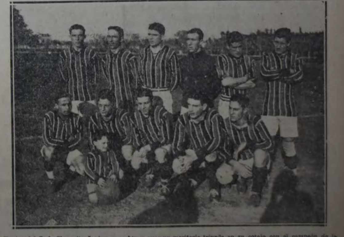
Equipo del C. A. Chacarita Juniors que obtuvo ayer un meritorio triunfo en su cotejo con el campeón de la anterior temporada