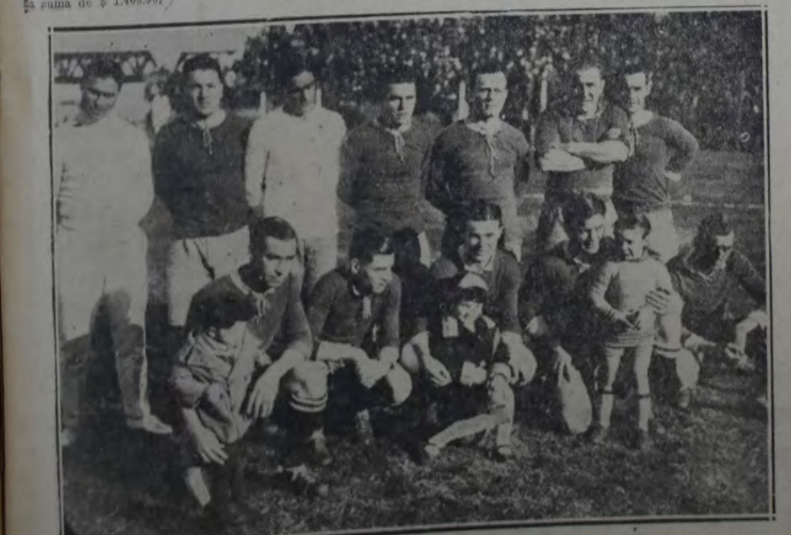
Conjunto del C. A. Independiente que ayer se rehabilitó al vencer por 3 tantos a 0 frente a su entusiasta y viejo rival: River Plate

En la defensa de los visitantes Sánchez y Anselmo jugaron bien; los demás poco felices, incluso el arquero, que no actuó como de costumbre.